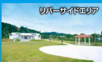
リバーサイドエリア