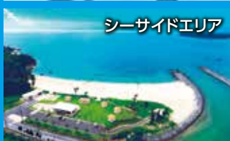
シーサイドエリア